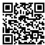
단체 바이어 사전등록 바로가기