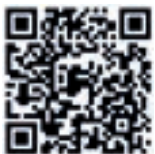
바이어 등록 바로가기